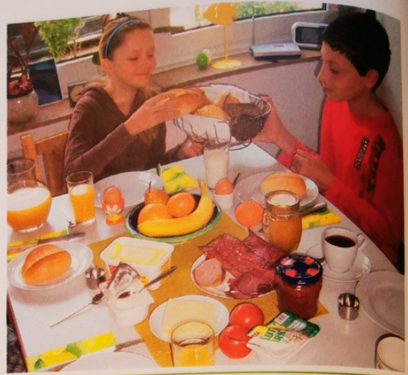
M2 Ein reich gedeckter Frühstückstisch