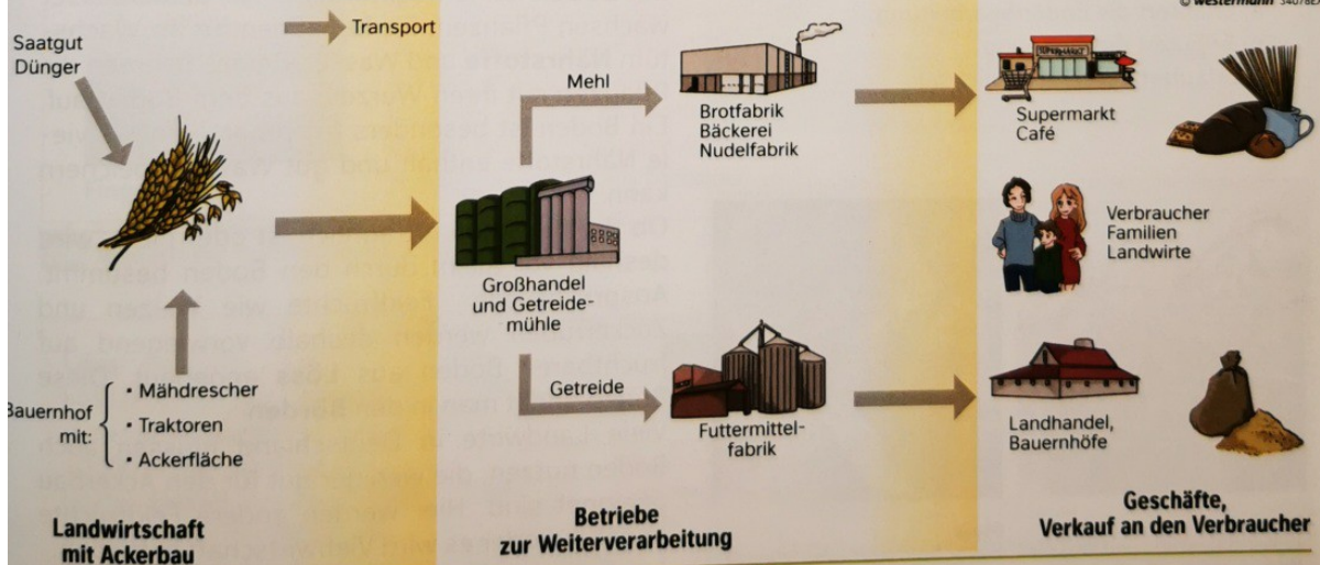
M6 Der Weg des Getreides vom Feld zum Verbraucher