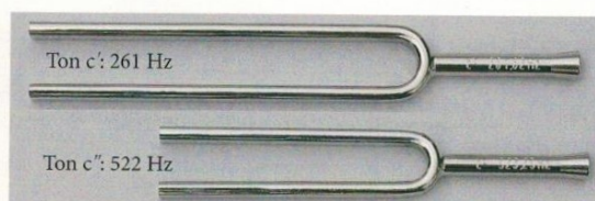
9 Stimmgabeln unterschiedlicher Frequenz